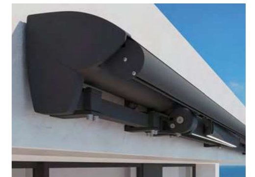
Bergen, Semi öppen