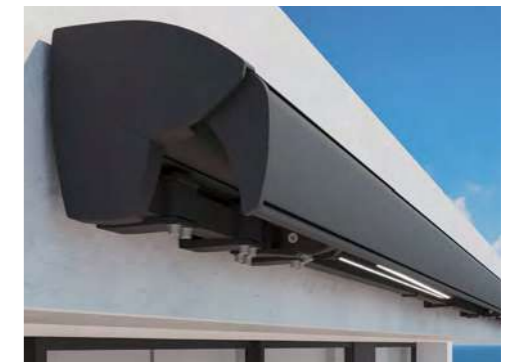
Bergen, Semi kasset